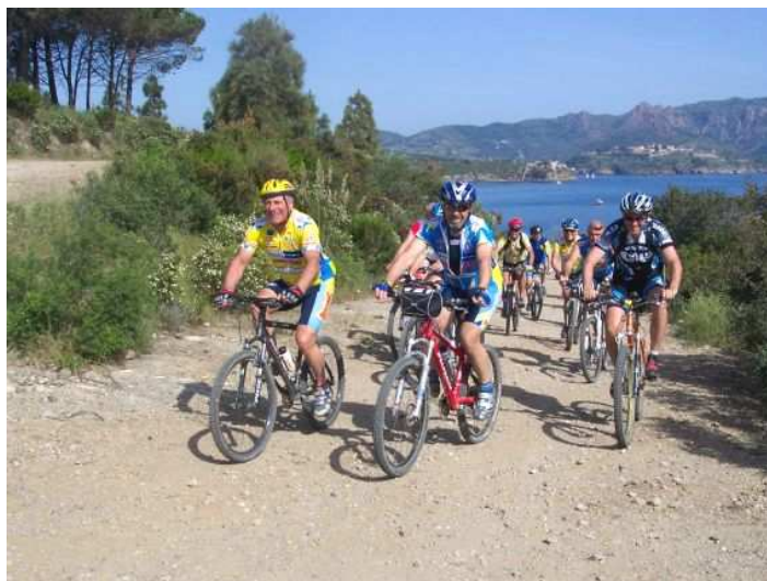
Ciclisti del Bitone durante un'escursione in MTB all'isola d'Elba nella gita organizzata a maggio scorso

Stagione terminata e adesso MTB sugli scudi