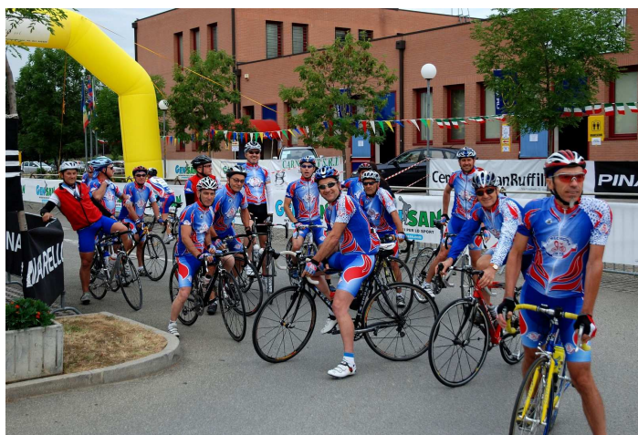
Una fase della Gran Fondo svoltasi presso il Circolo Benassi e facente parte del Campionato Italiano.

Nella medesima serata si terrà anche la premiazione del Giro dell'Appennino Bolognese, trittico di Gran Fondo facente parte del campionato nazionale di cui sopra. Ancora una volta al Benassi si terrà un'importante festa del ciclismo made in UISP, quel ciclismo che piace tanto anche al nostro gruppo del Bitone che farà gli onori di casa.