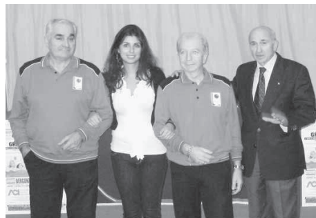
La premiazione della gara di categoria CD a Castel Maggiore