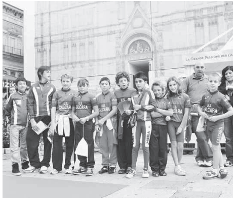
I ragazzi dell'Uc Calcara in Piazza Maggiore per il Giro dell'Emilia

Nel 29° Trofeo Parmeggiani, disputato sulle strade reggiane di Villa Argine di Cadelbosco di Sopra, la palma del migliore è andata al reggiano di Quattro Castella