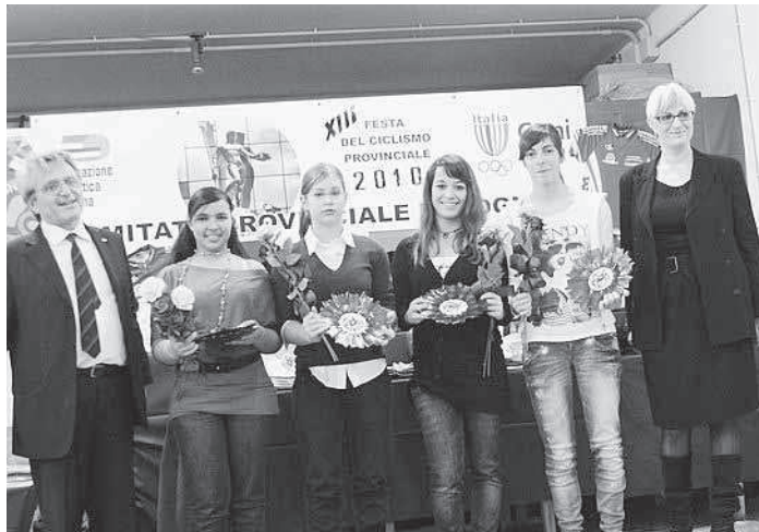
La premiazione delle categorie femminili Esordienti e Allieve

Insomma, una festa eccellente che ha avuto nelle vesti di spae-