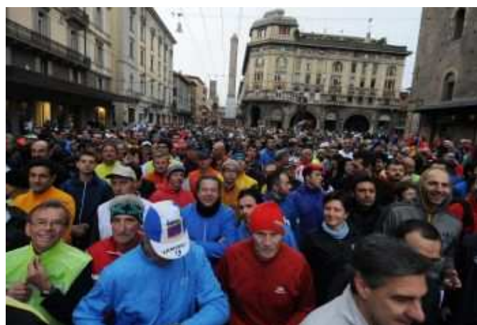
Nella foto la partenza della Strabologna 2010

Maggio è il mese in cui s'inizia a uscire da casa, le camminate aiutano a stare fuori, con manifestazioni in tutta la provincia e molte anche durante la settimana. Spesso le camminate sono inserite all'interno di feste, permettendo così un dopo camminata assieme alla famiglia. Nel mese appena passato, abbiamo ottenuto un buonissimo risultato: siamo stati il sesto gruppo (come numero di iscritti) alla Strabologna e per noi questo è senza dubbio motivo d'orgoglio.