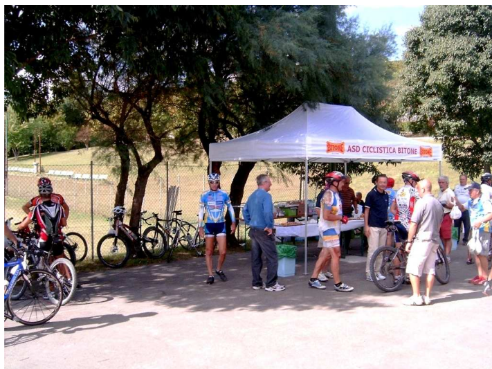
Il raduno MTB del 29 agosto 2010